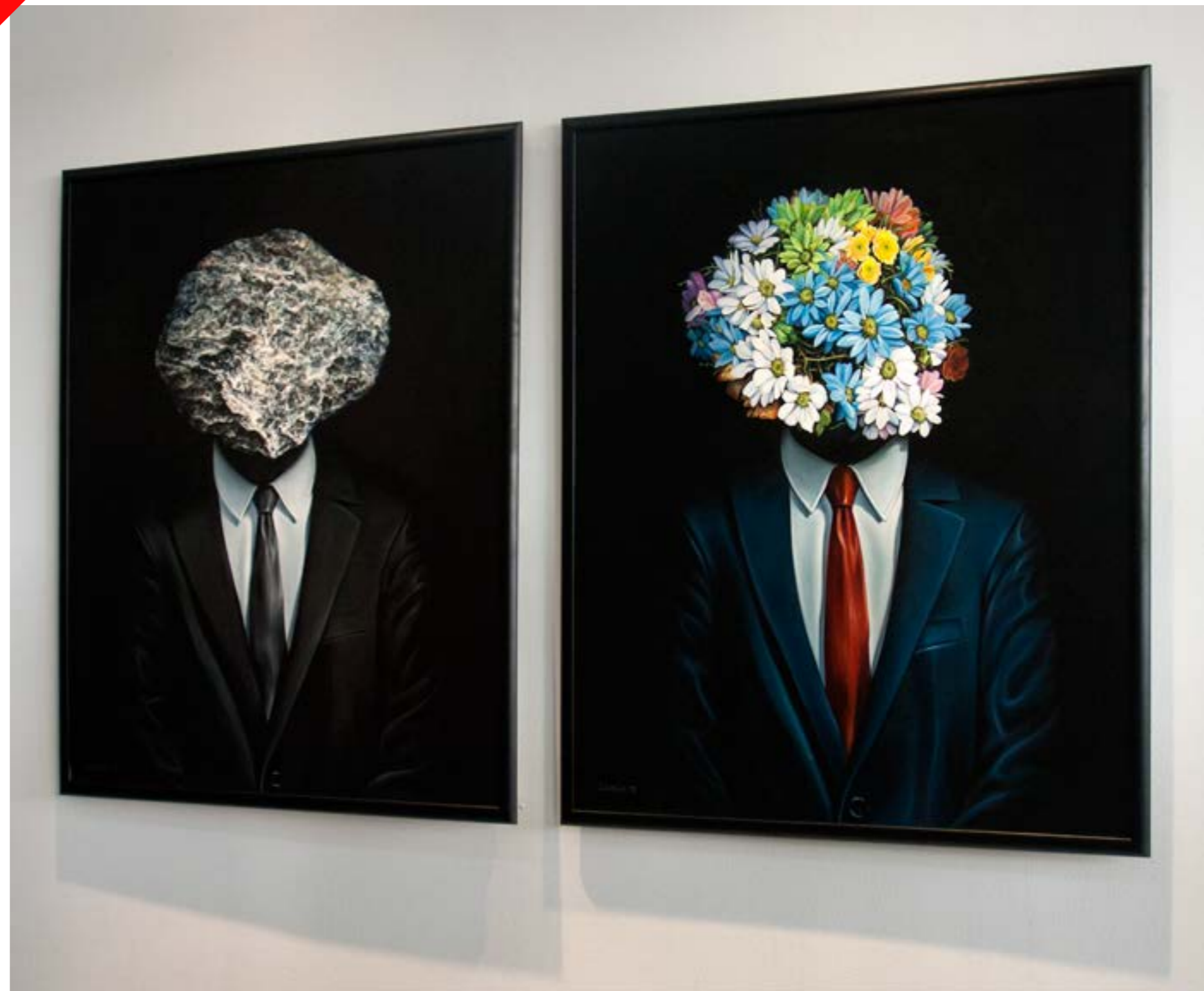
Estereo-tipos | Díptico | óleo sobre lienzo | 100 x 80 cm cada uno

Para gran cantidad de artistas, en los que me incluyo, significa mucho participar en Post-it porque es una muestra donde se miden todos por igual y me parece que es un salón muy bien organizado a un nivel de lo que se exige en el arte contemporáneo, para mí ya estar aceptado es un gran logro. ■■