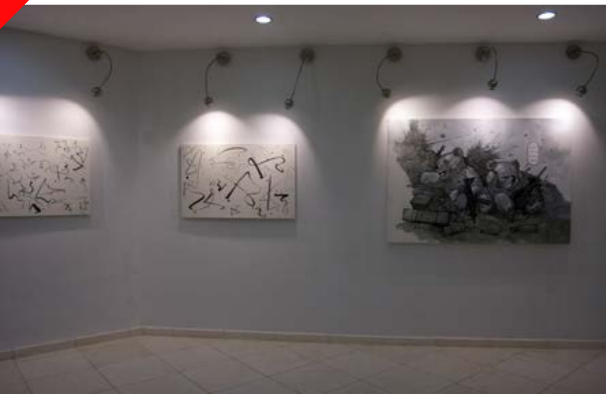
Vista parcial de Galería Artis 718

Este Post-it (curiosamente, y a diferencia de sus precedentes) favoreció la tradición y el discurso introspectivo. La pintura –y esto me sorprendió– es el género con mayor presencia dentro del evento