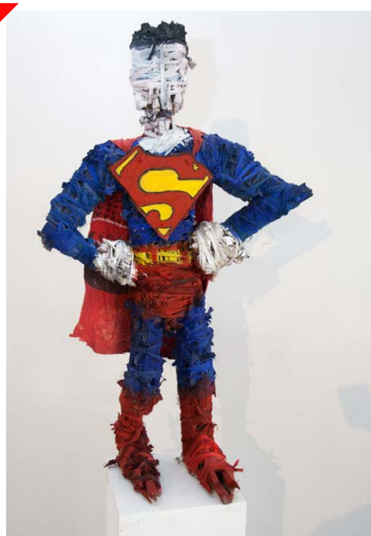
Serie "Materialización del objeto sonado III" | Técnica mixta | Dimensiones variables

Es un espacio criticado porque hay una hipocresía a nivel artístico donde se reprende el arte comercial. Al final todo en la vida es comercial, desde la palabra que tú dices, las letras, todo es comercial siempre que te paguen por tu acción. Ahora, muchas veces he dicho que lo que no puedes perder es tu identidad, y ahí es donde Post-it en ocasiones padece un poco. Por lo menos esta ocasión parece un poco más atrevida que las anteriores. Es crítica por eso, por cierto conservadurismo, y también porque la final no pueden hacer más, la final estamos en un momento histórico donde no puedes hacer nunca nada más acá o más allá. El primer Post-it no me gustó porque se estaban adoptando estéticas exteriores, no notaba una identidad de arte cubano, aunque sé que es un poco raro hablar de eso. ■■