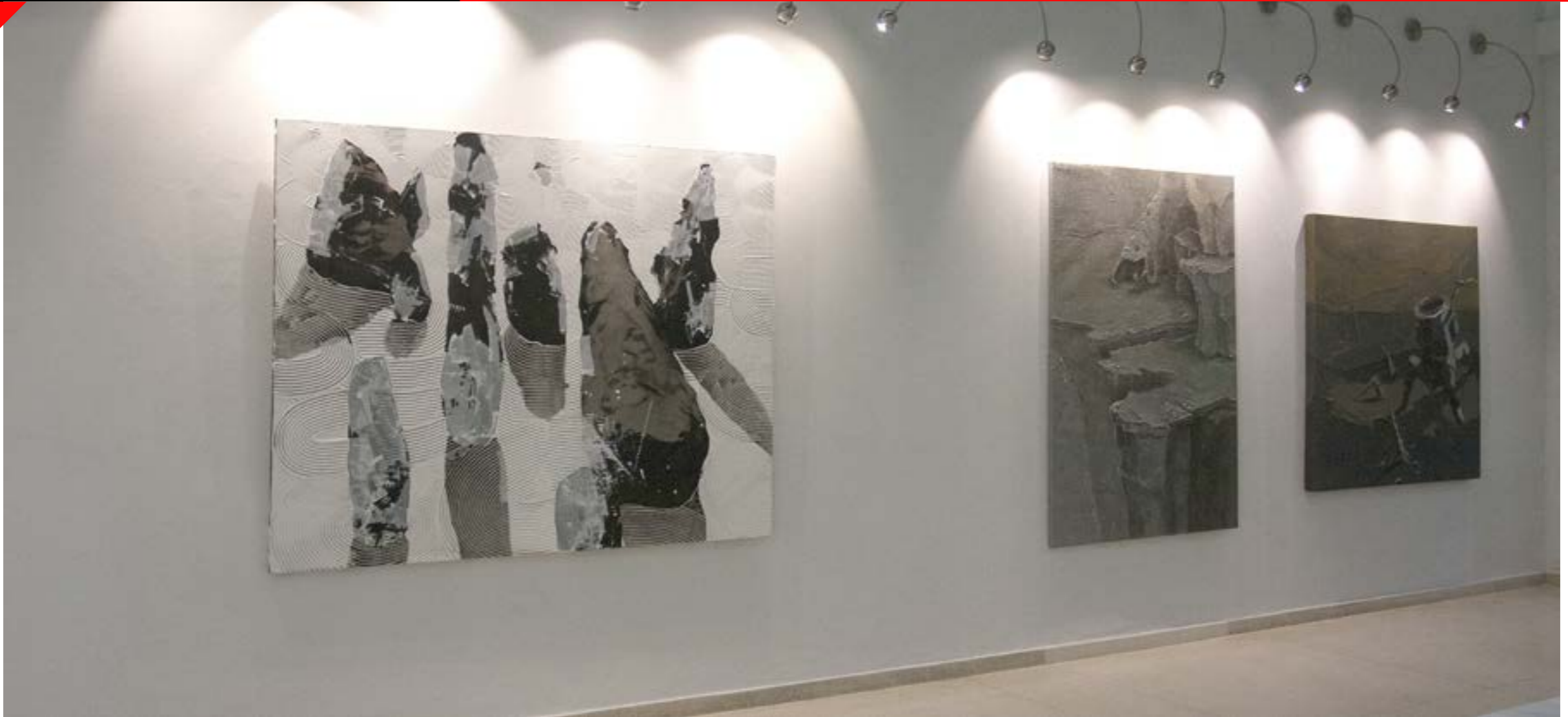
Vista parcial de la Galería Artis 718

diferentes. En Arte-Facto, se observa en una de las salas, cuatro cuadros que son de difícil diálogo entre ellos; Alice retrato de Lancelot Alonso, en el que emplea su característica paleta de colores estridentes cegaba la retina de los espectadores y no dejaba apreciar el resto de las propuestas. En Galiano, solo decir que, en la segunda sala, las fotografías estaban colocadas de un modo que agredía al público, no existe un descanso visual que permita asimilar el contenido de las obras.