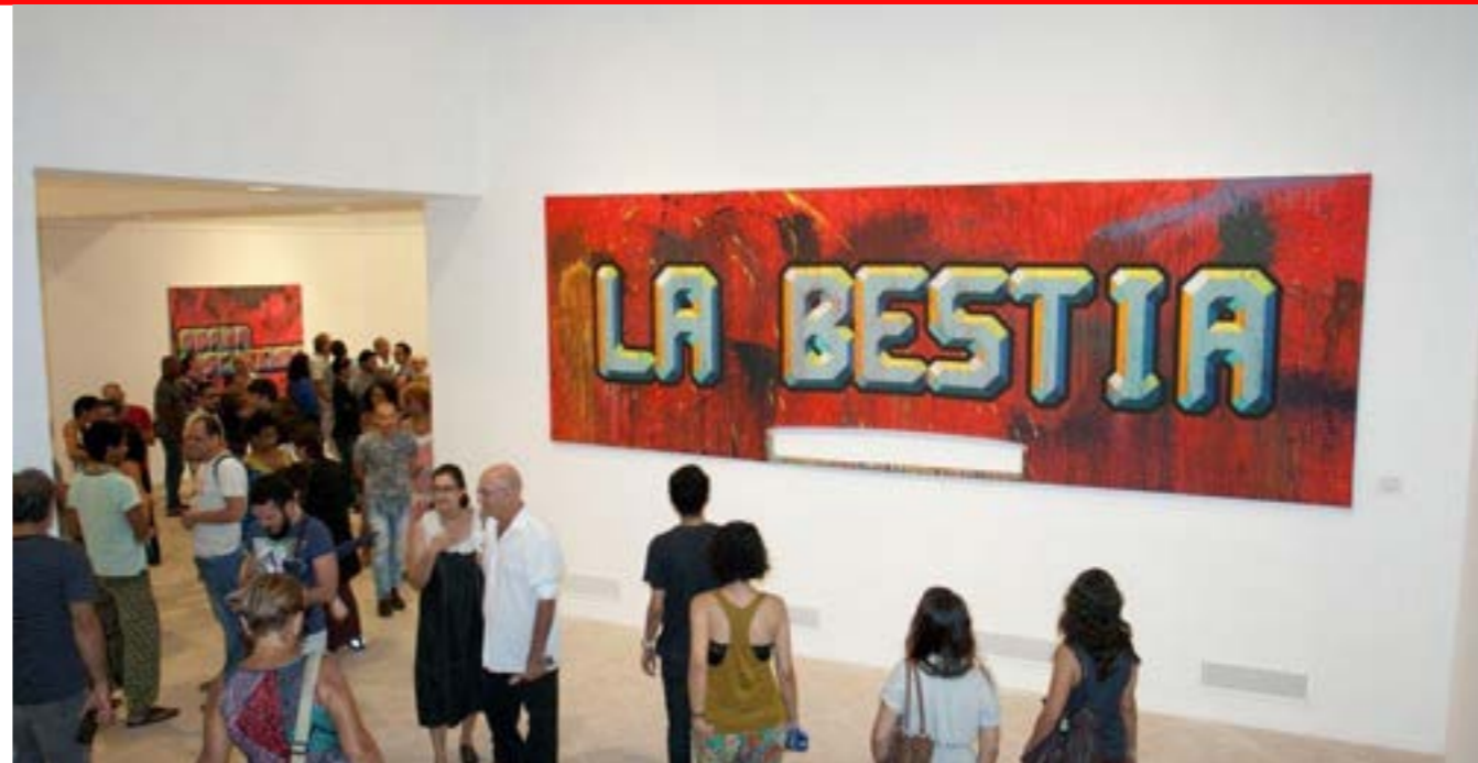
Vista parcial de la exposición

En este momento represento las cosas como son en realidad, como las estoy viendo y continúo redescubriendo.