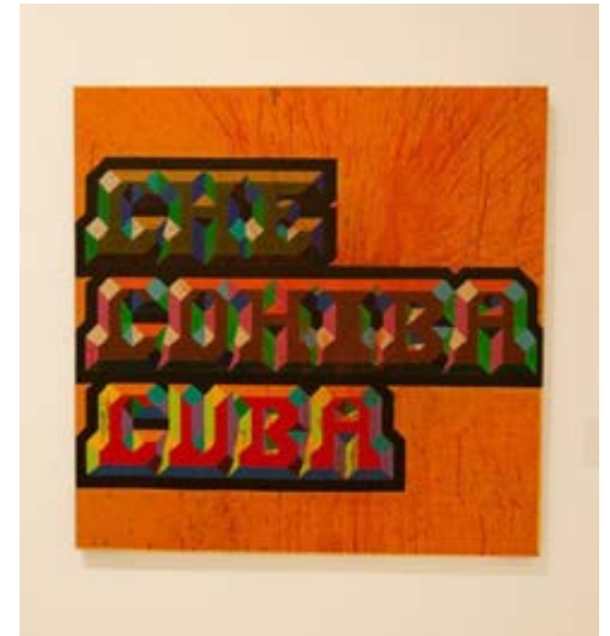
Cohiba / 2015 / Acrílico sobre tela / 100x100cm