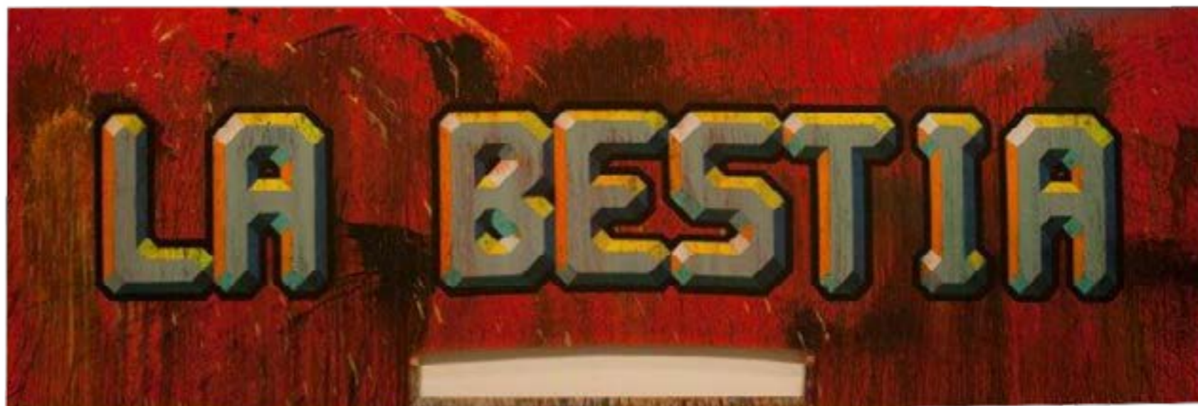
La-Bestia / 2016 / Acrílico sobre tela / 183x549cm