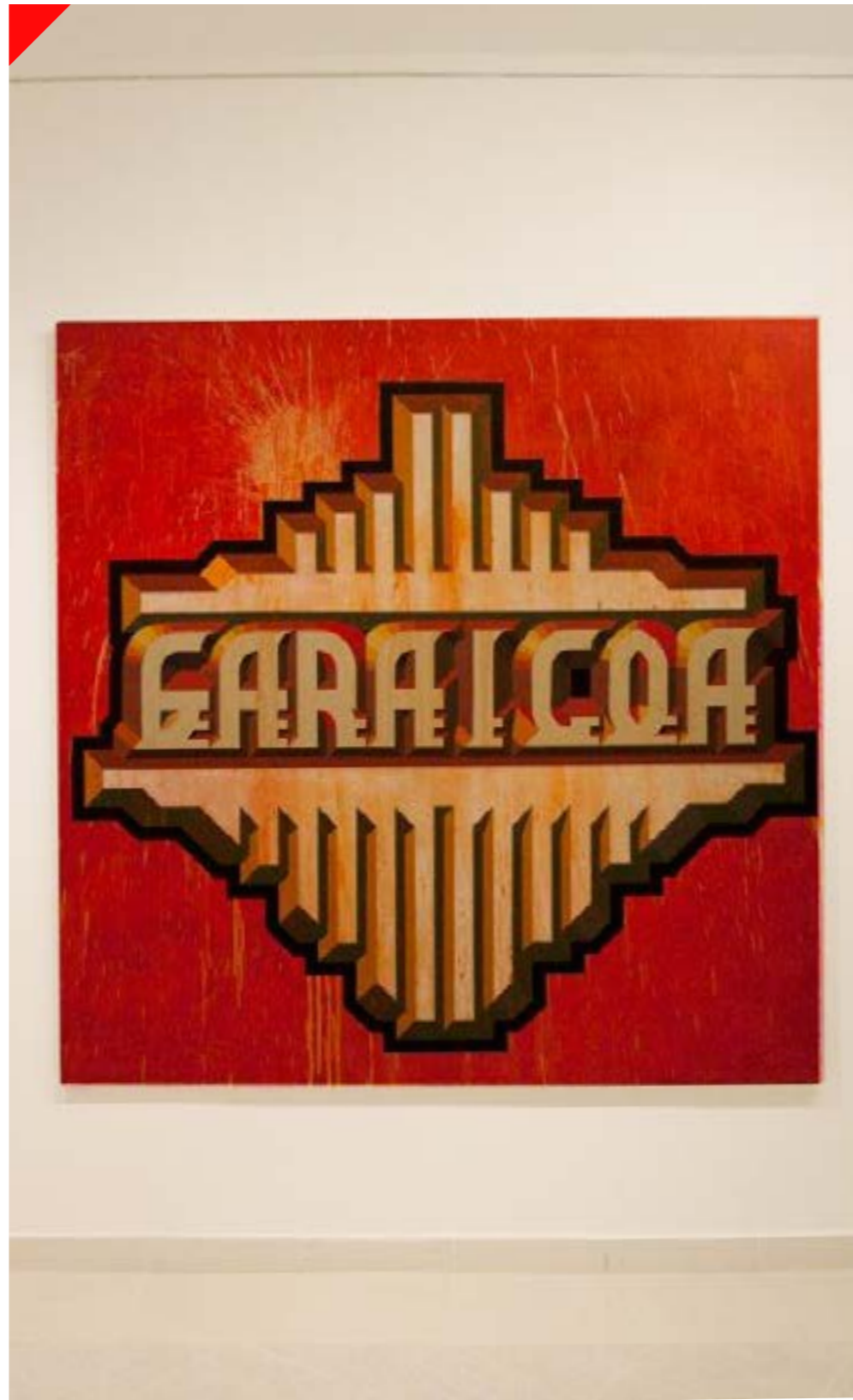
Garaicoa / 2015 / Acrílico sobre tela / 200x200cm

Once pinturas y once esculturas reconfiguran este universo visual. En el caso de los lienzos, aunque cada uno de ellos fue realizado en La Habana durante 2015 y 2016 no podría asegurarse que todo en ellos responde a lo novedoso. A nivel conceptual cada uno plantea un gesto diferenciable, aportado por la época misma en la que fueron creados y por tanto, un criterio nuevo resalta ante el espectador. Sin embargo, a nivel estético cada pieza descubre al Glexis de aquella Etapa Práctica, cuando marcó historia en exposiciones como No es lo que ves o Cuba OK .