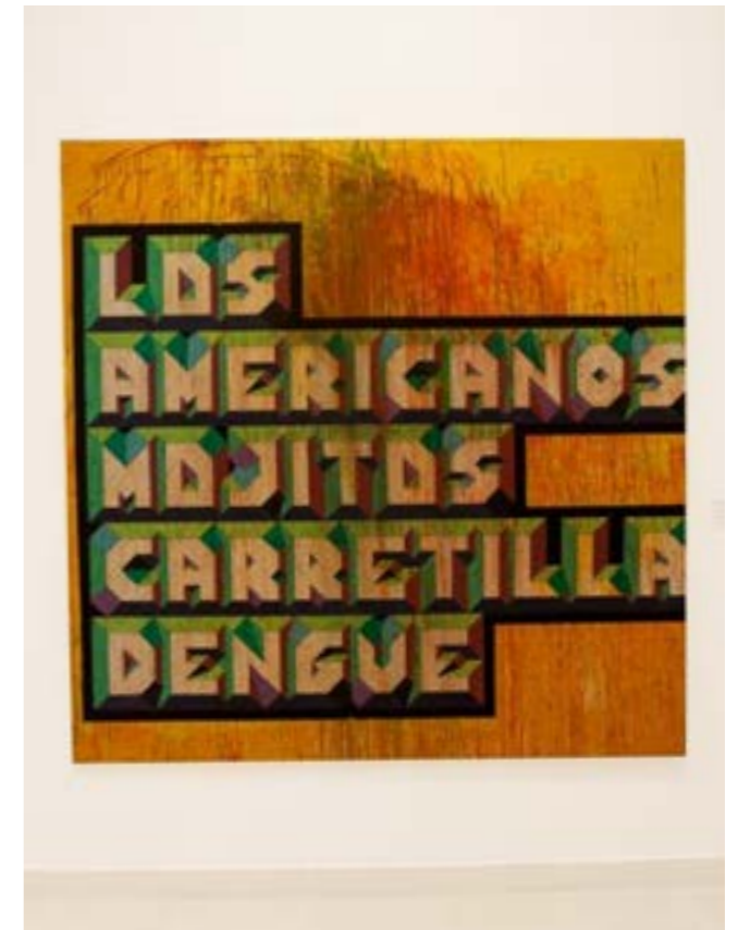
Los-americanos / 2016 / Acrílico sobre tela / 200x200cm