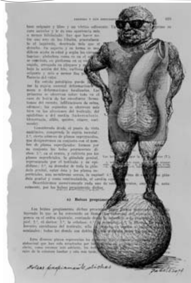
< Roberto Fabelo / Reflejarse sobre la cara / Dibujo a tinta sobre página del Tratado de Anatomía de Leo Testut / 2014 / < Bolsas propiamente dichas / Dibujo a tinta sobre página del Tratado de Anatomía de Leo Testut / 2014 / [Fotos: Romero]

Vista parcial de la exposición, Museo de Arte Latinoamericano, California / [Fotos cortesía de Juanito Delgado]