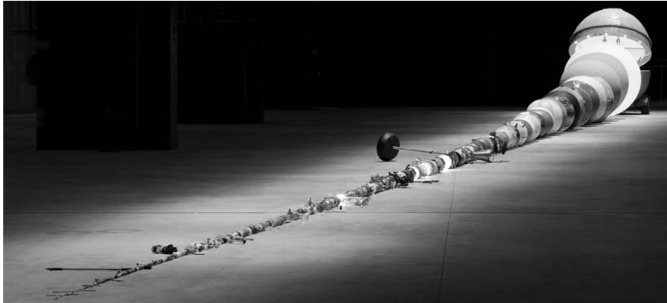
Wilfredo Prieto / Avalancha / Instalación / 2003 /